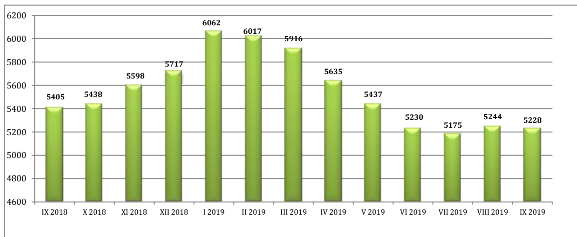
Wykres 2. Liczba bezrobotnych w powiecie kłodzkim w okresie: wrzesień 2018 r. – wrzesień 2019 r.

Na koniec września 2019 r. liczba zarejestrowanych bezrobotnych w powiecie kłodzkim wynosiła 5228 osób i w porównaniu do stanu z końca sierpnia zmniejszyła się o 16 osób.