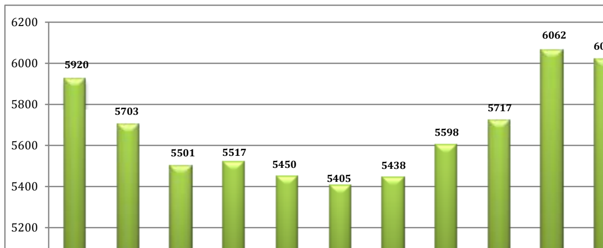
Wykres 2. Liczba bezrobotnych w powiecie kłodzkim w okresie: kwiecień 2018 r. – kwiecień 2019

Na koniec kwietnia 2019 r. liczba zarejestrowanych bezrobotnych w powiecie kłodzkim wynosiła 5635 osób i w porównaniu do stanu z końca marca 2019 r. spadła o 281 osób.